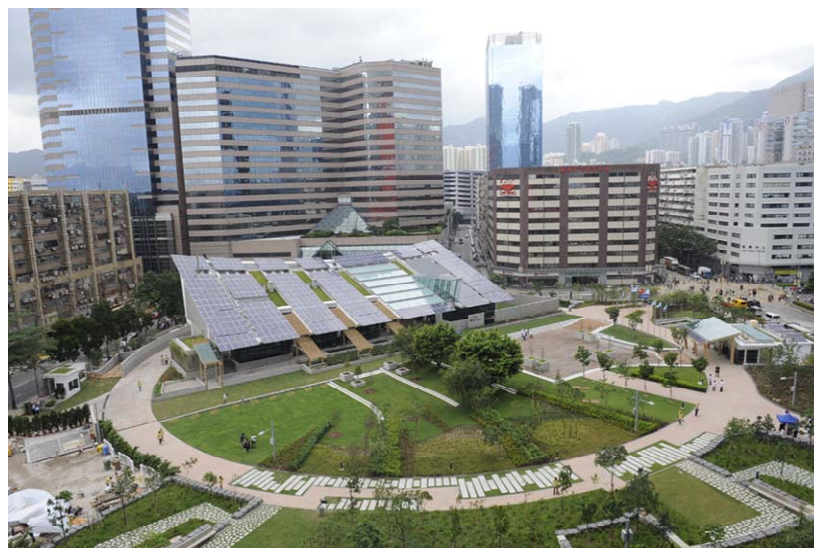
圖 2. 香港的零碳天地

香港首座零碳建築名為「零碳天地」( http://zcb.hkcic.org )，位於九龍灣常悅道，造價2.4億港元，於2012年6月揭幕。「零碳天地」佔地14,700平方米，當中包括室內及戶外的展覽場地、會堂、綠色辦公室、綠色家居、公眾休憩綠化區及香港首個都市原生林。該建築是直接連通至當地